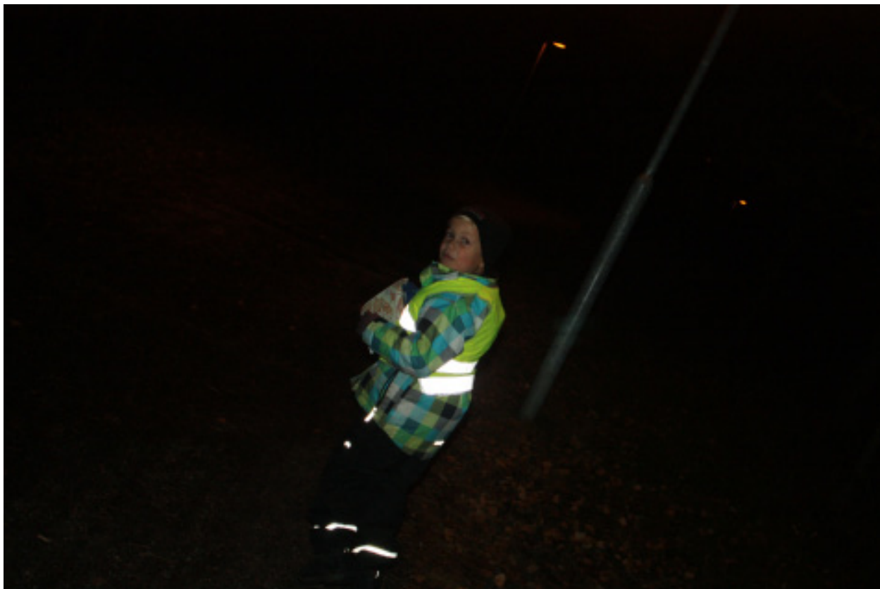
Den yngste trygghetavandraren hittills