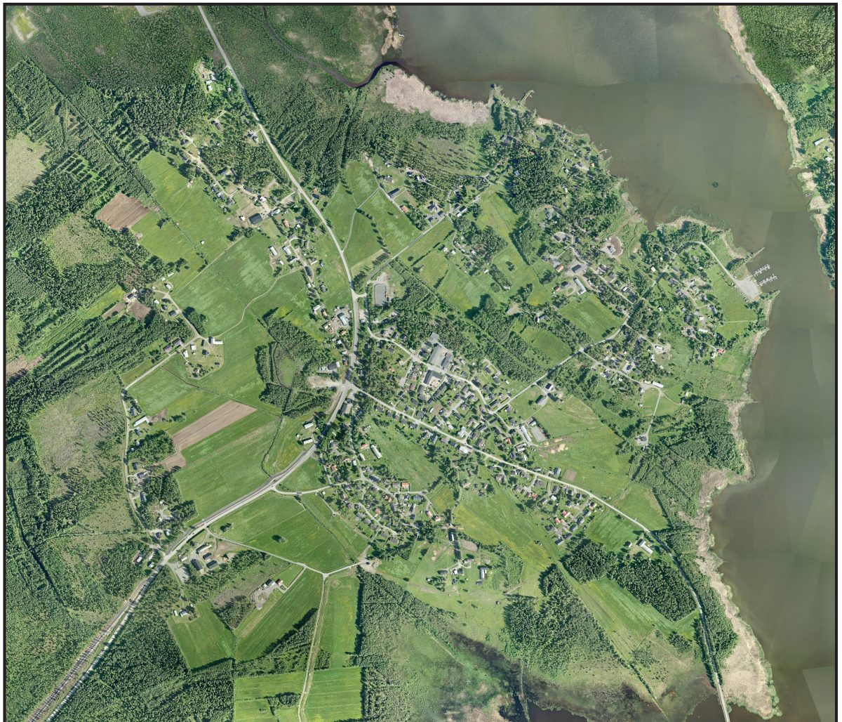
Flygfoto över Bensbyn

- Odlingsbar jord tas i anspråk för bebyggelse