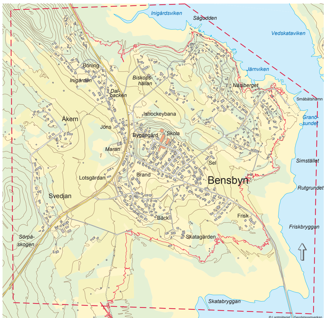
Topografin beskrivs med höjdkurvor. Nivån + 2.5 m ö h markerad med röd linje.

Lokalklimatet inom planområdet präglas i första hand av topografin/terrängen i samverkan med vegetation och bebyggelse. Inom planområdet varierar markhöjden från 0 till drygt 23 meter över havet (se karta nedan). Dessa terrängförhållanden styr till stor del lokalklimatets egenskaper, där högre belägna markområden är mer utsatta för vind och lägre mer skyddade. Samtidigt är lågpunkter mer utsatta för kalluft vintertid, med åtföljande högre energiförbrukning och delvis sämre boendekvalitet. Sluttningssområden som exponeras mot söder får högre solinstrålning och gynnsammare lokalklimat än nordligt exponerade sluttningssområden. Inom planområdet finns flera sluttningssområden. Centrala byn, som är belägen på en höjdrygg,